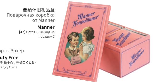
曼纳怀旧礼品盒 Подарочная коробка от Manner Manner [47] Gates C · Выход на посадку C