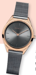
手表 Наручные часы Watch & Sunglasses [36] Gates C · Выход на посадку C