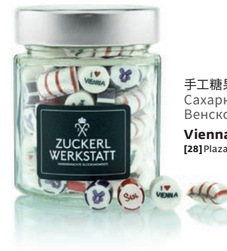
手工糖果工厂·维也纳版 Сахарная мастерская, Венское издание Vienna's Best [28] Plaza