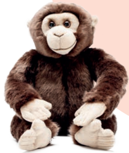
毛绒玩具 Мягкая игрушка Heinemann Duty Free [22, 40, 50, 61, 62] 购物中心、登机口 C & D · Plaza, Выход на посадку C и D