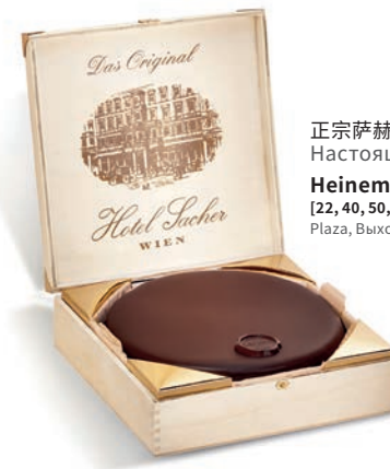
正宗萨赫蛋糕 Настоящие торты Захер Heinemann Duty Free [22, 40, 50, 61, 62] 购物中心、登机口 C & D · Plaza, Выход на посадку C и D