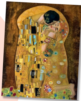
装饰画 „吻“ (古斯塔夫·克林姆特) Постер „Поцелуй“ (Густав Климт) Senses Of Austria [35, 42, 52] 购物中心、登机口 C & D · Plaza, Выход на посадку C и D