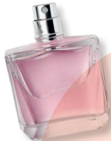
香水 Парфюмерия Heinemann Duty Free [22, 40, 50, 61, 62] 购物中心、登机口 C & D · Plaza, Выход на посадку C и D